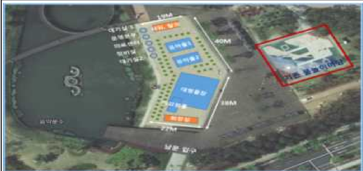
어린이 물놀이장 설치(안)