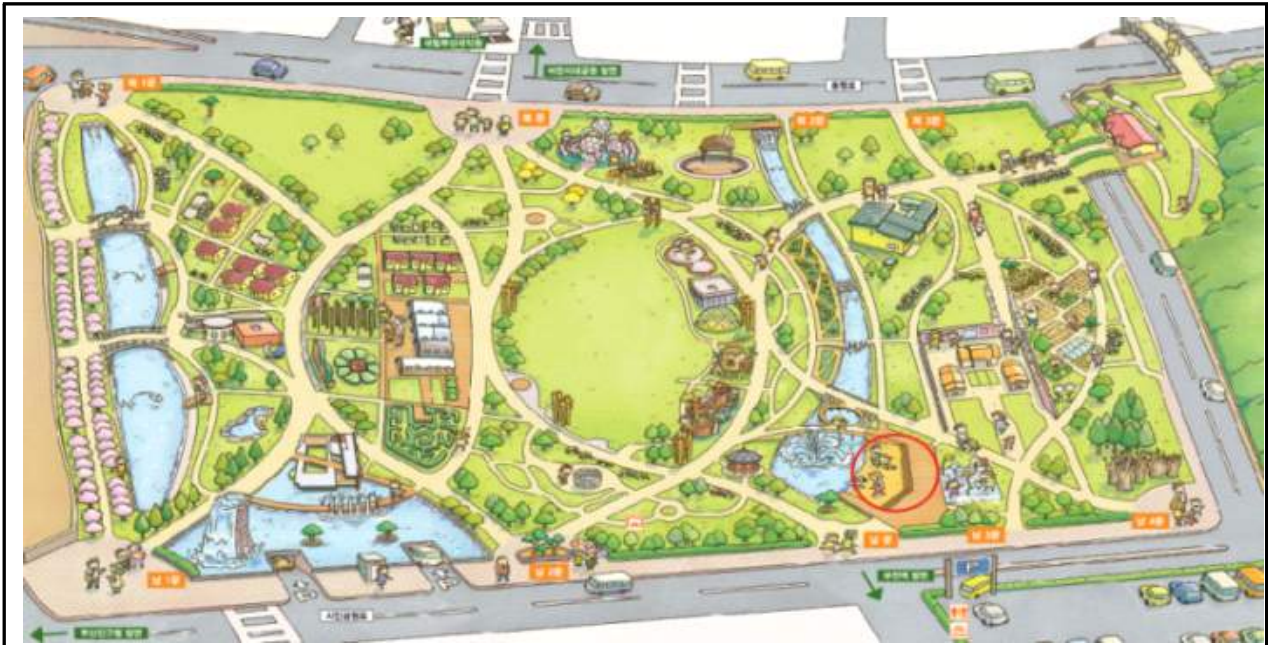
어린이 물놀이장 설치위치(도심백사장)