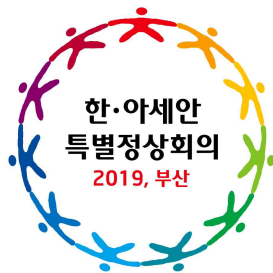
2019 한·아세안 특별정상회의 2019 한·아세안 특별정상회의

2019 ASEAN-Republic of KOREA Commemorative Summit