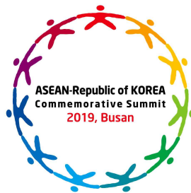
한·아세안 특별정상회의 2019

2019 ASEAN-Republic of KOREA Commemorative Summit