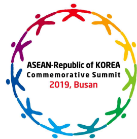
한·아세안 특별정상회의 2019, 부산

ASEAN-Republic of KOREA Commemorative Summit 2019