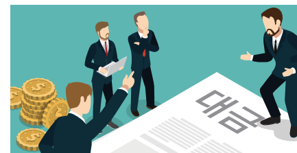
건축물의 건축 등에 따른 설계 등 용역 대금 관련 분쟁