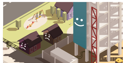
인근 건축 공사로 인한 일조·조망 등 피해의 분쟁