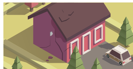
인근 건축 공사로 인한 균열·누수 등 건축물 피해의 분쟁