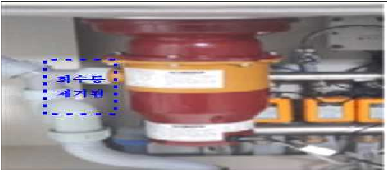
회수통(2차 처리기) 제거 후 분쇄기에서 하수구 배관으로 음식물 쓰레기 전량 배출