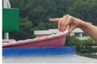
물탱크 부적합 뚜껑