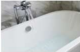
욕조 등에 물을 장시간 보관