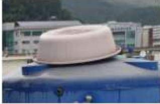
옥상 물탱크 뚜껑