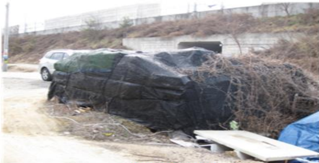
기와 보관 상태