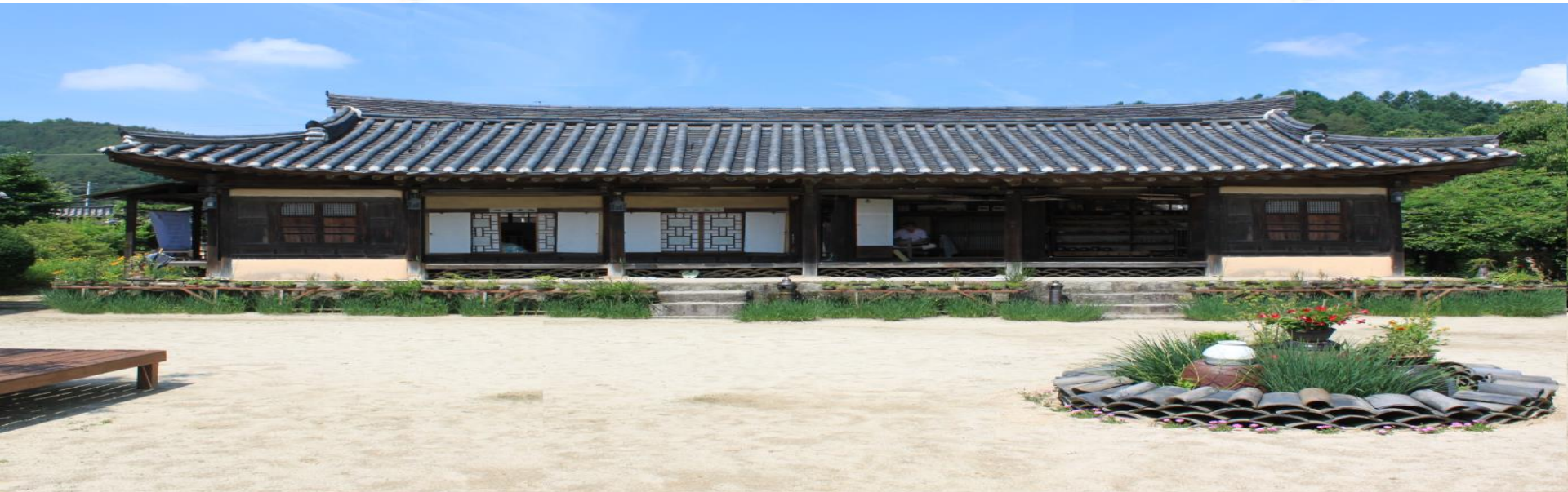
금당 최규용 고택(一자형 건축물/복원 후 예상모습)