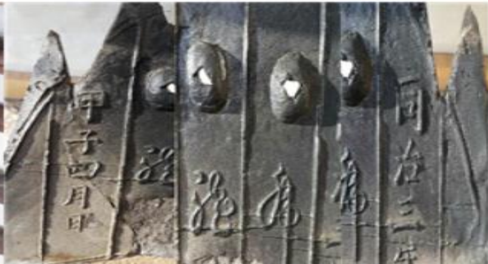
기와 제작년도 (갑자1864년 4월)