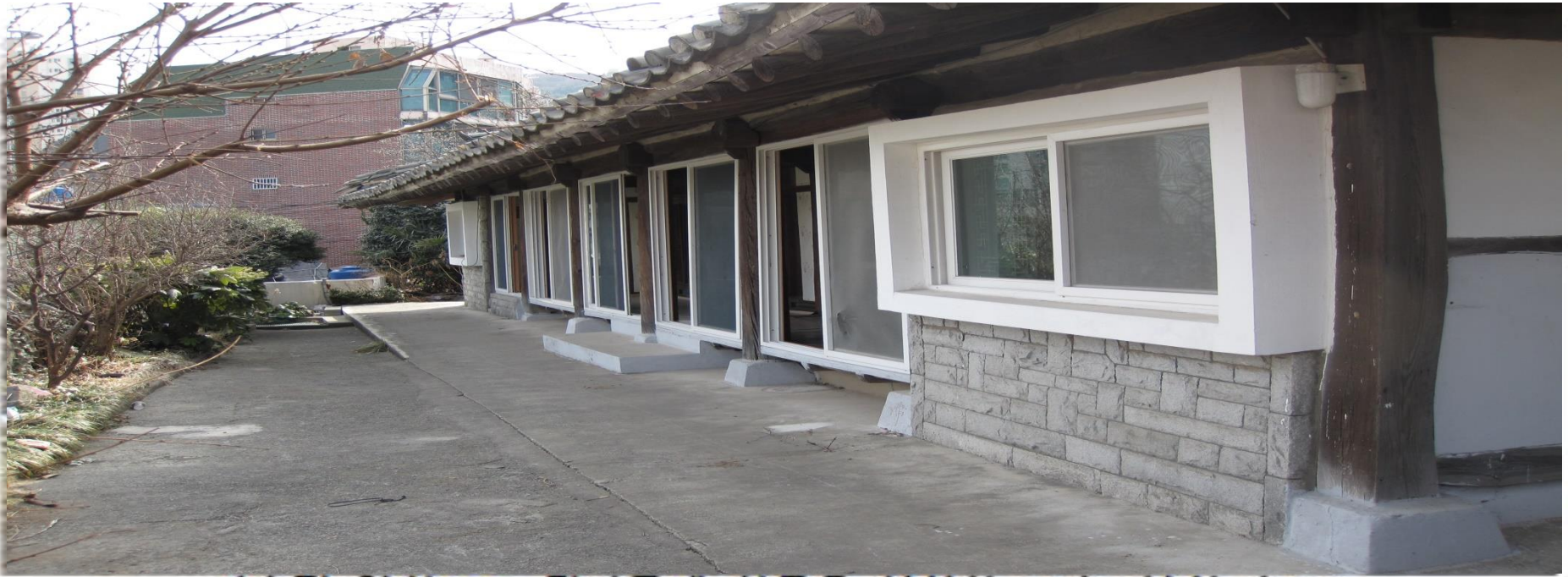
기후적 영향으로 뒷마루에 창틀을 설치한 모습 (부산 송도)