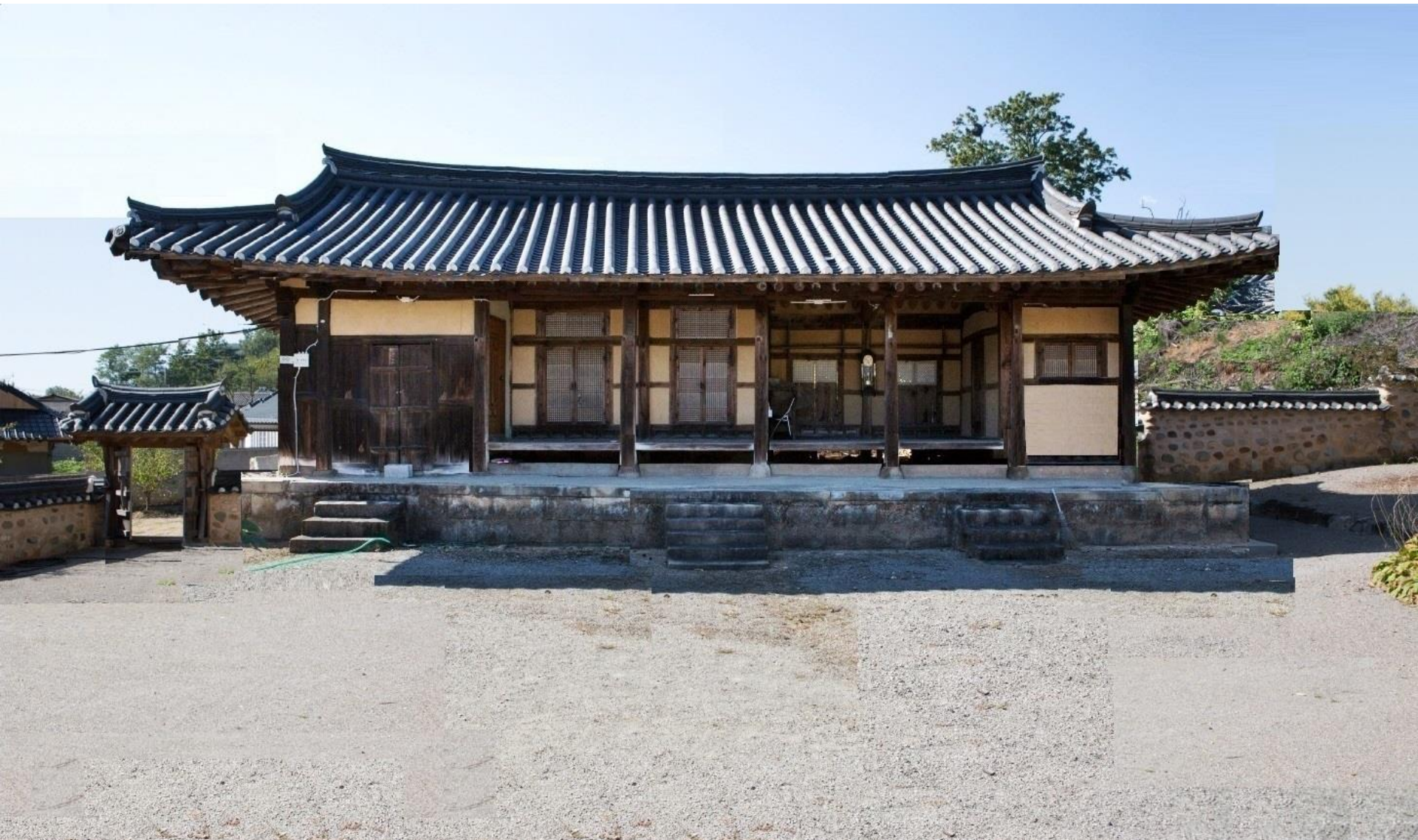
금당 최규용 고택 (1864년 원형, 경남 산청)