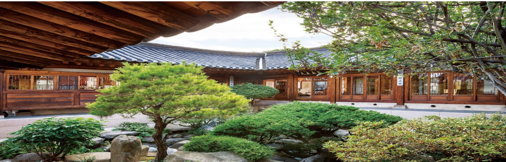
신축한옥(ㄷ자형 건축물) 및 안마당