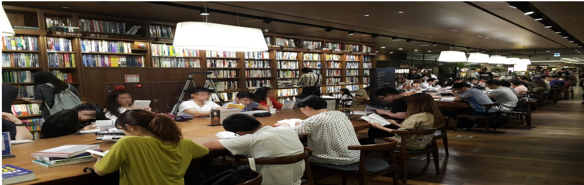
도서관 (서고 및 열람공간)