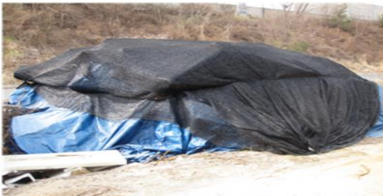
목구조 자재 상태