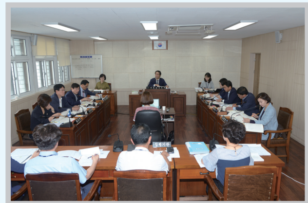
주민도시보건위원회 ▶ Resident, City and Health Committee