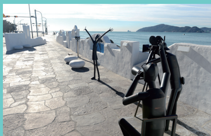
바다와 영화가 어우러진 마린시티 해변길 영화의 거리 Movie Street