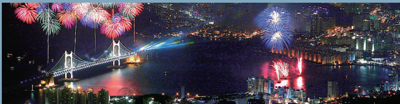
장산에서 바라보는 해운대 전경 Panoramic View of Haeundae viewed from Mt. Jangsan