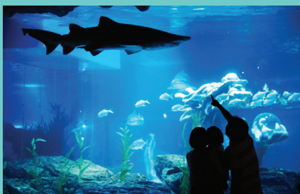
도심 속에 펼쳐진 수중 생태계의 신비 부산아쿠아리움 Busan Aquarium