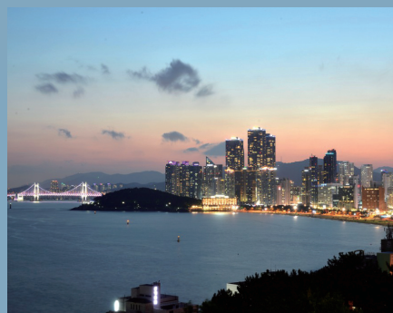
달맞이언덕에서 바라보는 해운대해수욕장 Haeundae Beach viewed from Dalmaji Hill