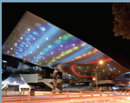
APEC나루공원에서 바라보는 영화의전당 Busan Cinema Center viewed from APEC Naru Park