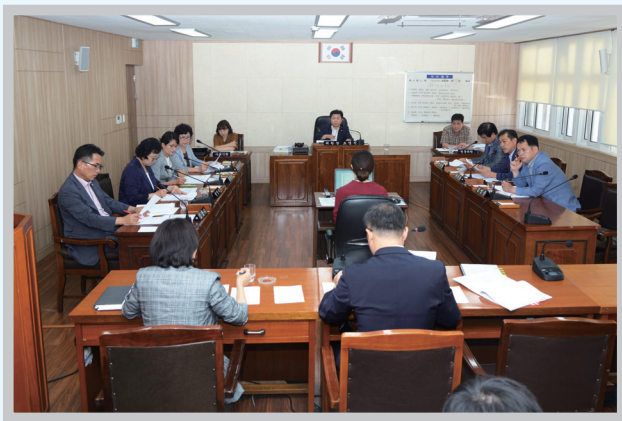
▲ 기획관광행정위원회 Planning, Tourism and Administration Committee