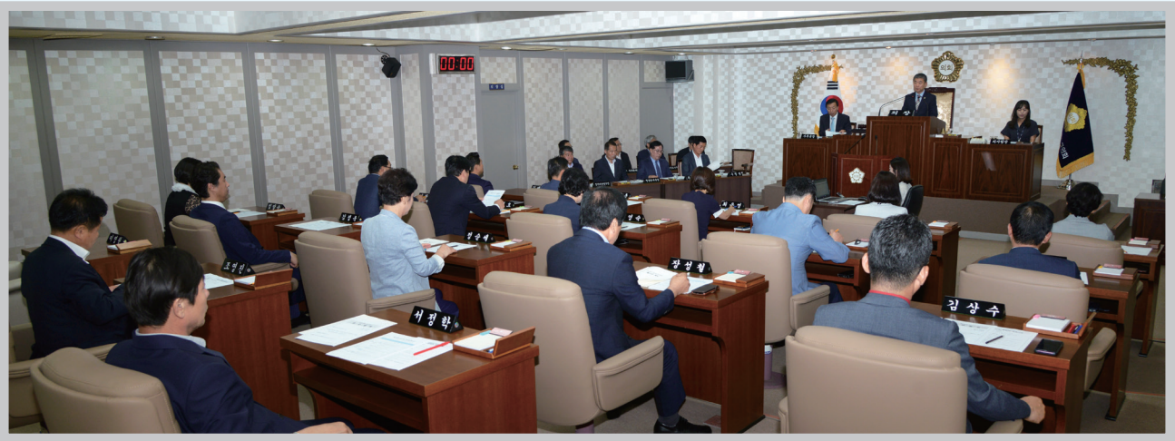
▲ 본회의 Main Session