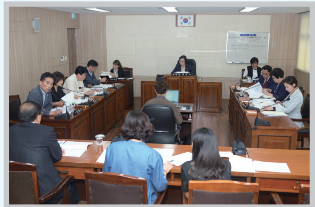
의회운영위원회 ▶ Council Steering Committee