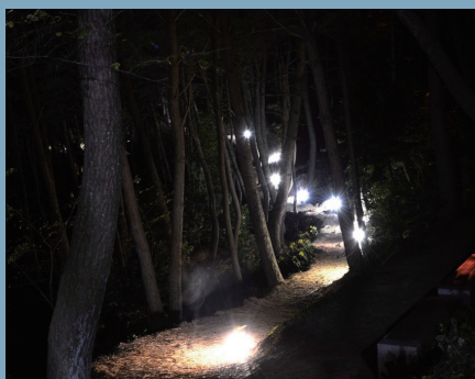
달맞이언덕 문탠로드 Moontan Road of Dalmaji Hill