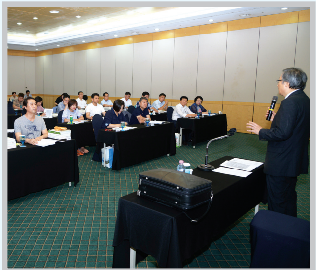
국내연수 - 경주