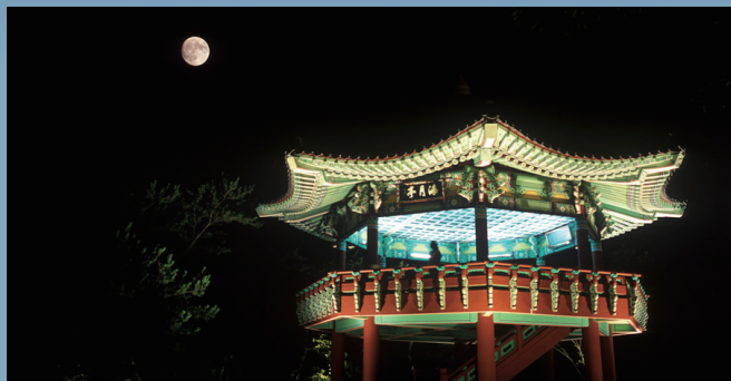
해월정에서 바라보는 월출 Moonrise viewed from Haewoljeong Pavilion