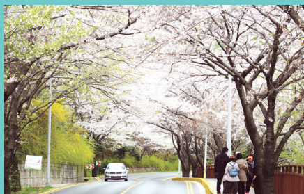
엽인과 함께 하고픈 드라이브 명소 달맞이길 Dalmaji-gil