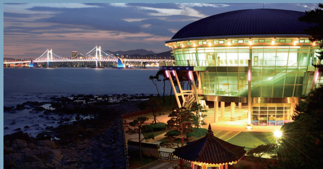
동백섬 등대광장에서 바라보는 누리마루APEC하우스와 광안대교 Nurimaru APEC House & Gwangnan Bridge viewed from Lighthouse Plaza