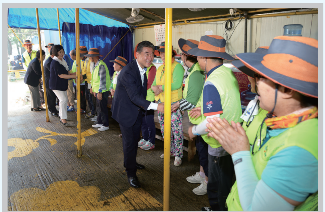
해수욕장 근무자 격려