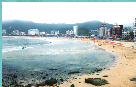
천혜의 자연을 간직한 아름다운 해변 송정해수욕장 Songjeong Beach