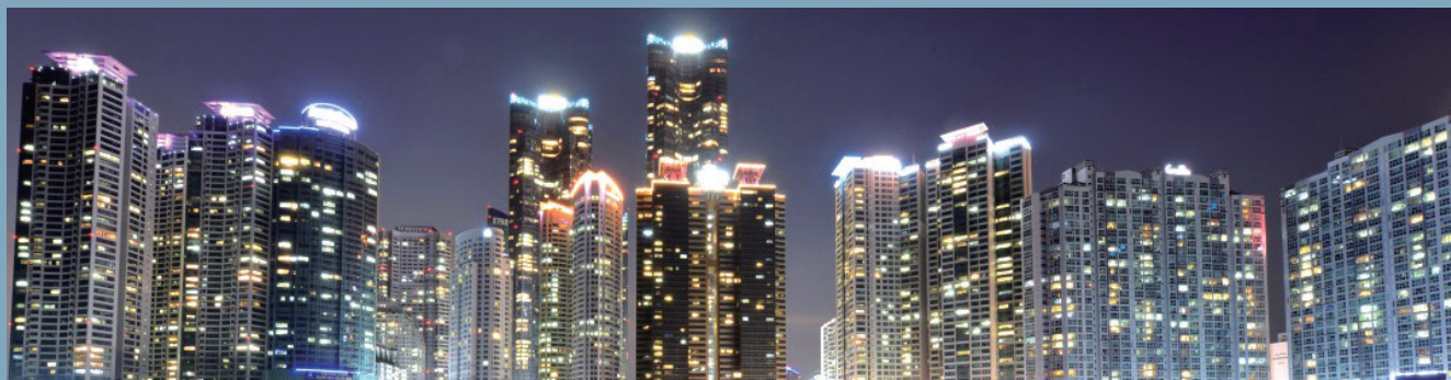
동백섬 선착장에서 바라보는 마린시티 Marine City viewed from Dongbaek Island Ferry