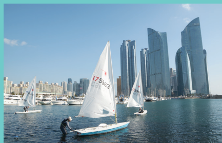
아시아 최대 규모의 해양스포츠 메카 수영만 요트경기장 Suyoungman Yacht sports arena