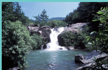
사시사철 정겨운 해운대 진산 장산 Mt. jangsan