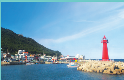
일출이 아름다운 도심 속 포구 청사포 Cheongsapo Harbor