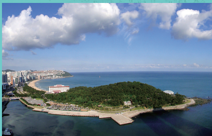
세계인이 반한 눈부신 자연경관 동백섬 Dongbaek Island