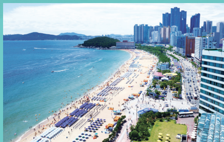
대한민국을 대표하는 세계적 휴양지 해운대해수욕장 Haeundae Beach